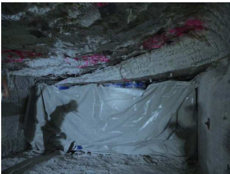
Figure 3 : Désordres miniers sur le bloc 21.

Dans certains blocs, les déchets contribuent au soutènement du stockage.