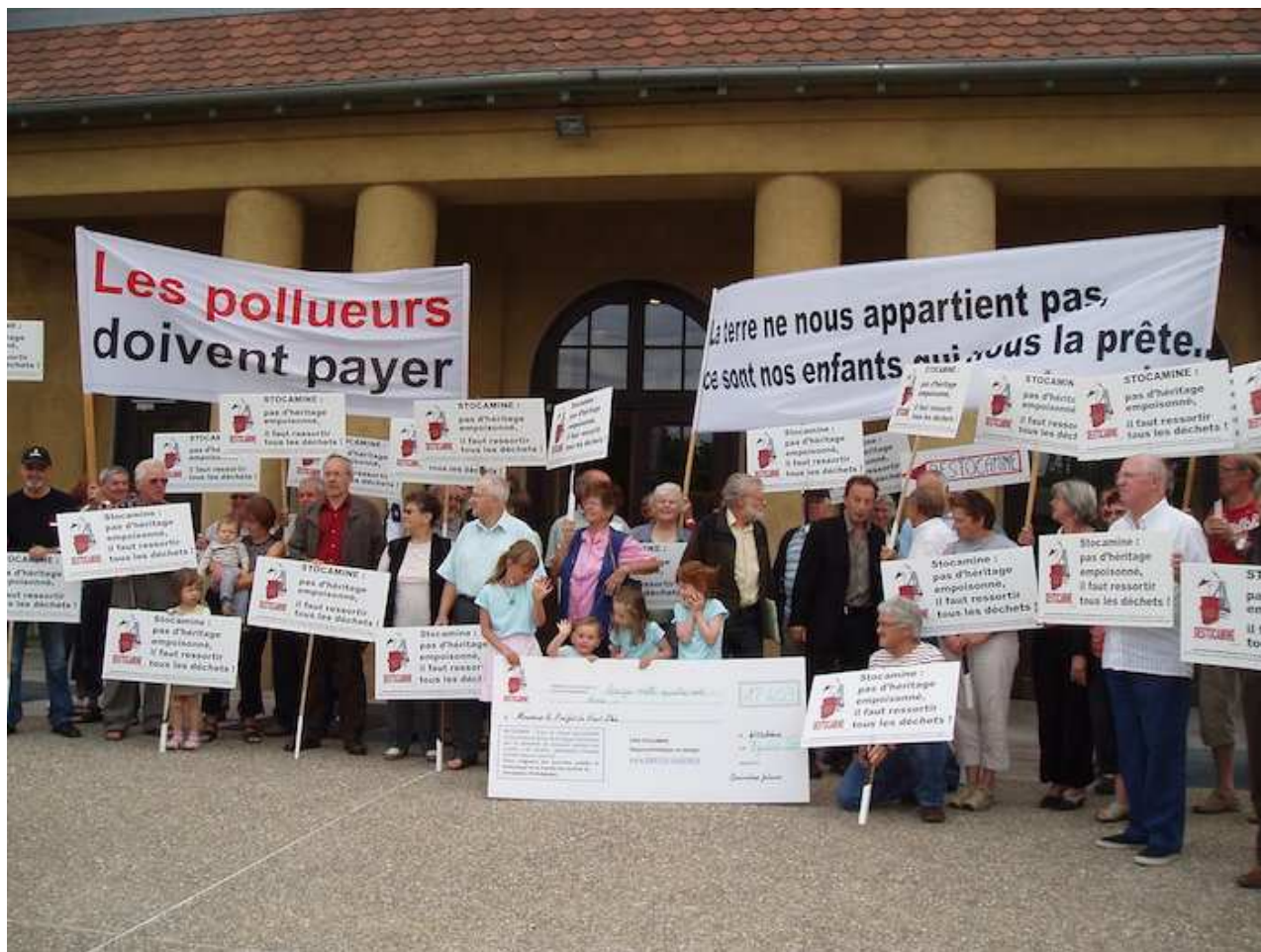
Remise d'une pétition, le 7 juillet 2011, demandant au préfet le déstockage total lors d'une réunion de la Clis.

le nez pendant cent, voire mille ans. Résultat, aujourd'hui, au bout de même pas dix-huit ans, les cavités se cassent la gueule » sur les sacs de déchets. Un membre de la CFDT (Confédération française démocratique du travail) qui souhaite rester anonyme abonde dans ce sens : « Au début, quand nous stockions les déchets, nous laissons de l'espace sur les côtés pour la réversibilité. Mais, au bout d'un moment, on nous a fait empiler les 'big bags' sur toute la hauteur de la galerie, et nous avons bien vu que cela rendrait le déstockage très difficile. Nous avons compris que l'objectif du centre était l'enfouissement définitif des déchets et nous l'avons ressenti comme une trahison. »