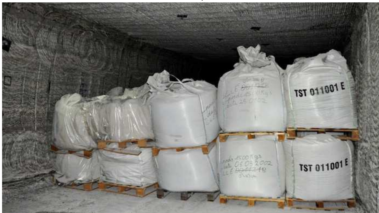
Des « big bags ».