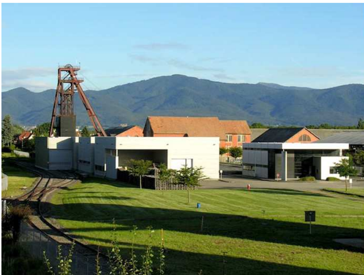
Le site de Stocamine.