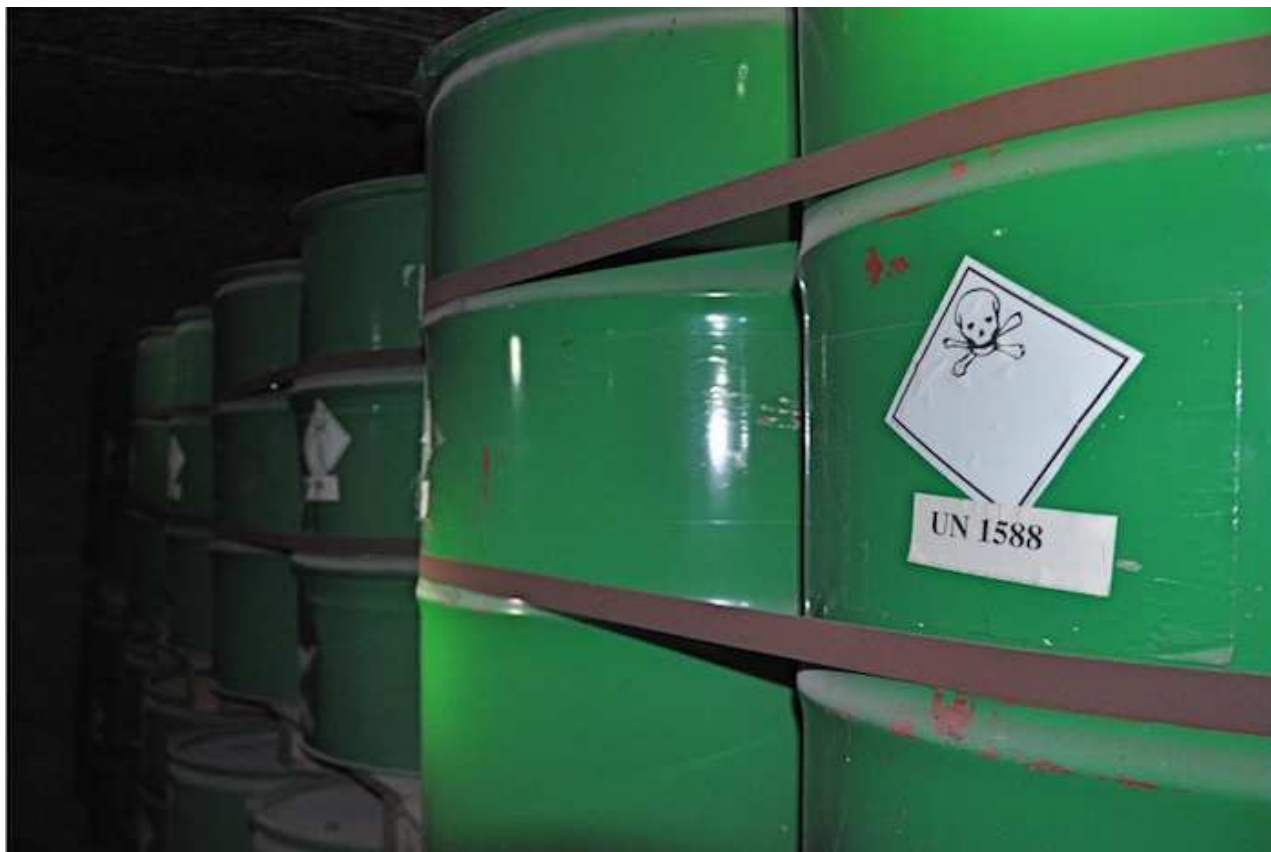
Des fûts de déchets.

contrôle plus rien. » « Pour ce qui est des déchets de classe 1 — déchets amiantés et résidus d'épuration des fumées d'incinération des ordures ménagères —, on peut très bien les garder dans des centres de stockage en surface prévus pour ça », complète le membre de la CFDT.